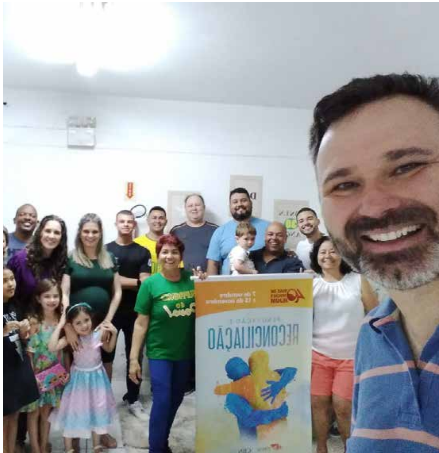
IBN Luz Para as Nações Blumenau/SC