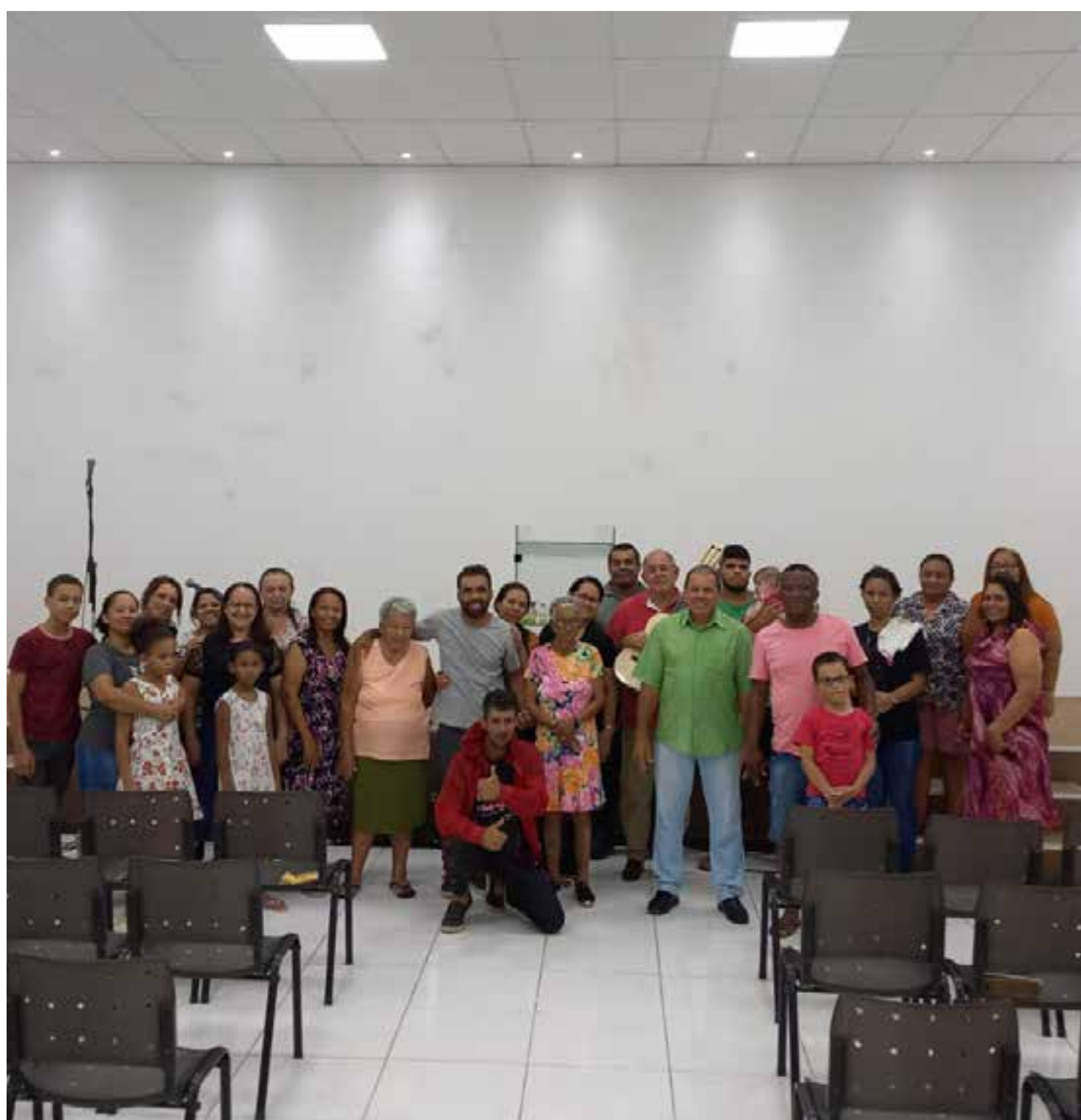
IBN Novo Tempo Rondonópolis/MT