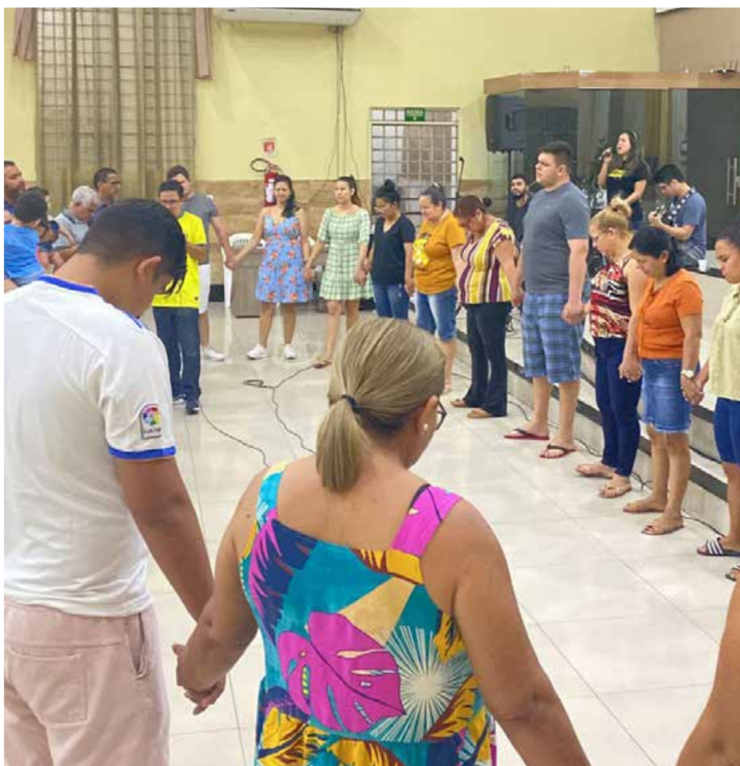
Igreja Batista Nacional Vida Manaus/AM