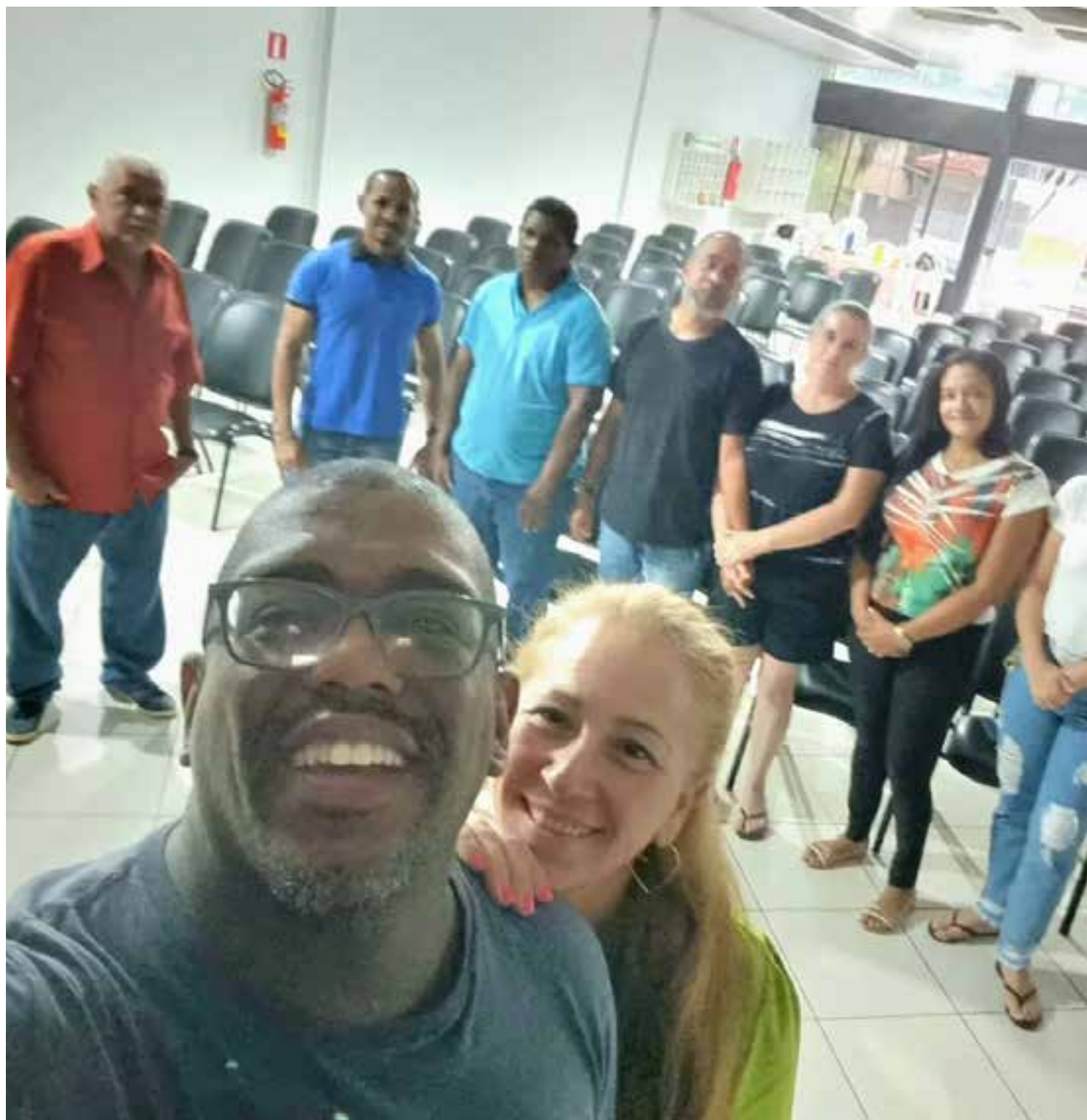
IBN em Peixoto de Azevedo/MT

“Senhor, poderoso Deus visita a cada um de nós, com a tua renovação espiritual e nos fortaleça sempre no primeiro amor por Ti todos os dias e acrescenta a nossa sabedoria vinda do Seu coração em nós.”