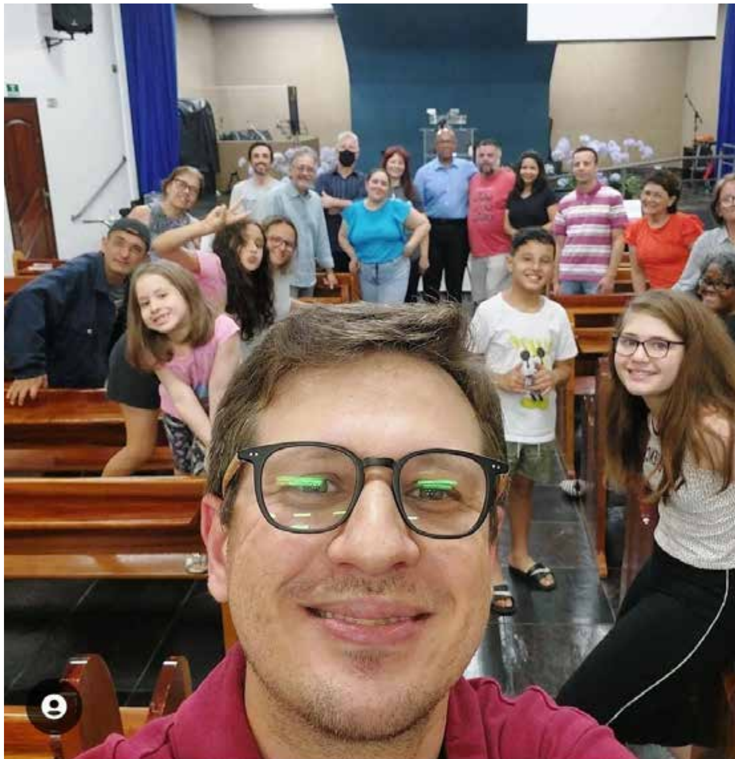
IBN Vila Maria/SP